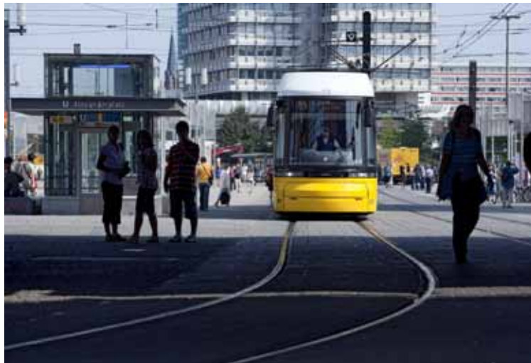
Auch zwischen den Jahren arbeiteten die BVG-Mitarbeiter.