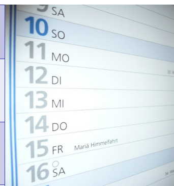
Kommende Termine und Sitzungen der VKA 2011