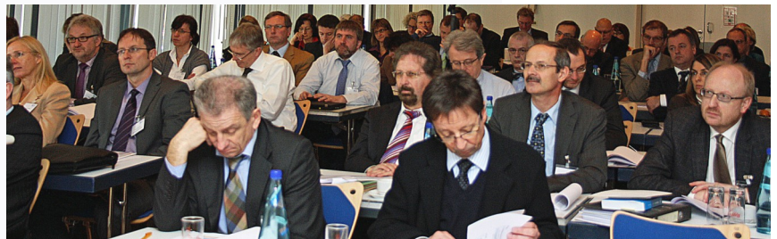
Gemeinsame Sitzung der VKA am 9. Februar 2011 in Frankfurt