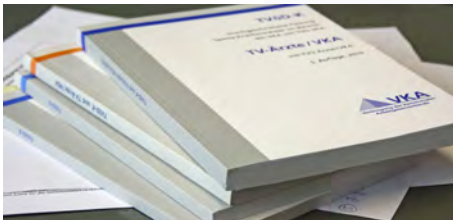
Die Tarifverträge der VKA im Krankenhausbereich: Der „ Tarifvertrag für den öffentlichen Dienst, Besonderer Teil Krankenhäuser – TVöD-K “ und der „ Tarifvertrag für die Ärztinnen und Ärzte an kommunalen Krankenhäusern (TV-Ärzte/VKA) “.

Für die nicht-ärztlichen Beschäftigten an kommunalen Krankenhäusern gilt der „Tarifvertrag für den öffentlichen Dienst, Besonderer Teil Krankenhäuser (TVöD-K)“. Dieser hat eine Mindestlaufzeit bis Ende Februar 2012.