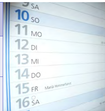
Kommende Termine und Sitzungen der VKA 2011