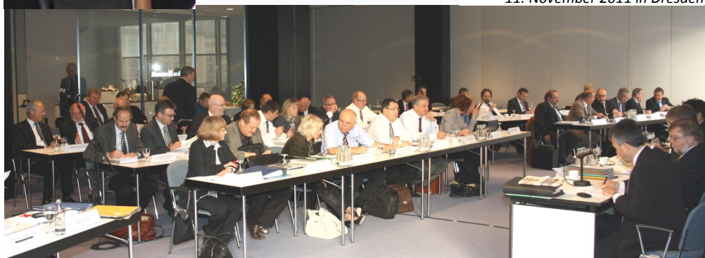
Die Mitgliederversammlung am 11. November 2011 in Dresden