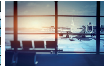
Die Folgen der Corona-Pandemie: enorme finanzielle Einbrüche an den Flughäfen und ein steigendes Kreditausfallrisiko bei den Sparkassen.

sind. Im öffentlichen Personennahverkehr (ÖPNV) schlugen ebenfalls enorme Einnahmeverluste aufgrund geringer Ticketverkäufe zu Buche. Vielerorts wurden die Angebote im ÖPNV zwar aufrechterhalten, jedoch nur ein Bruchteil der Fahrgäste hat diese auch genutzt. Und im Kitabereich kam der Betrieb größtenteils durch behördlich angeordnete Schließungen zum Erliegen (ausgenommen Notbetreuung).